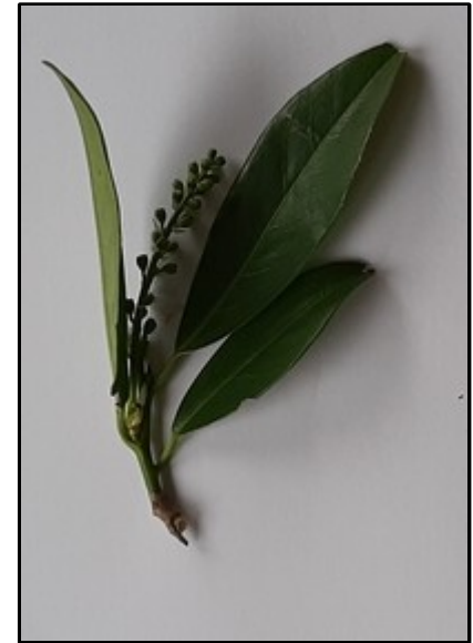
Photographie n° C