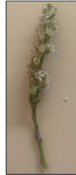
Photographie n° F